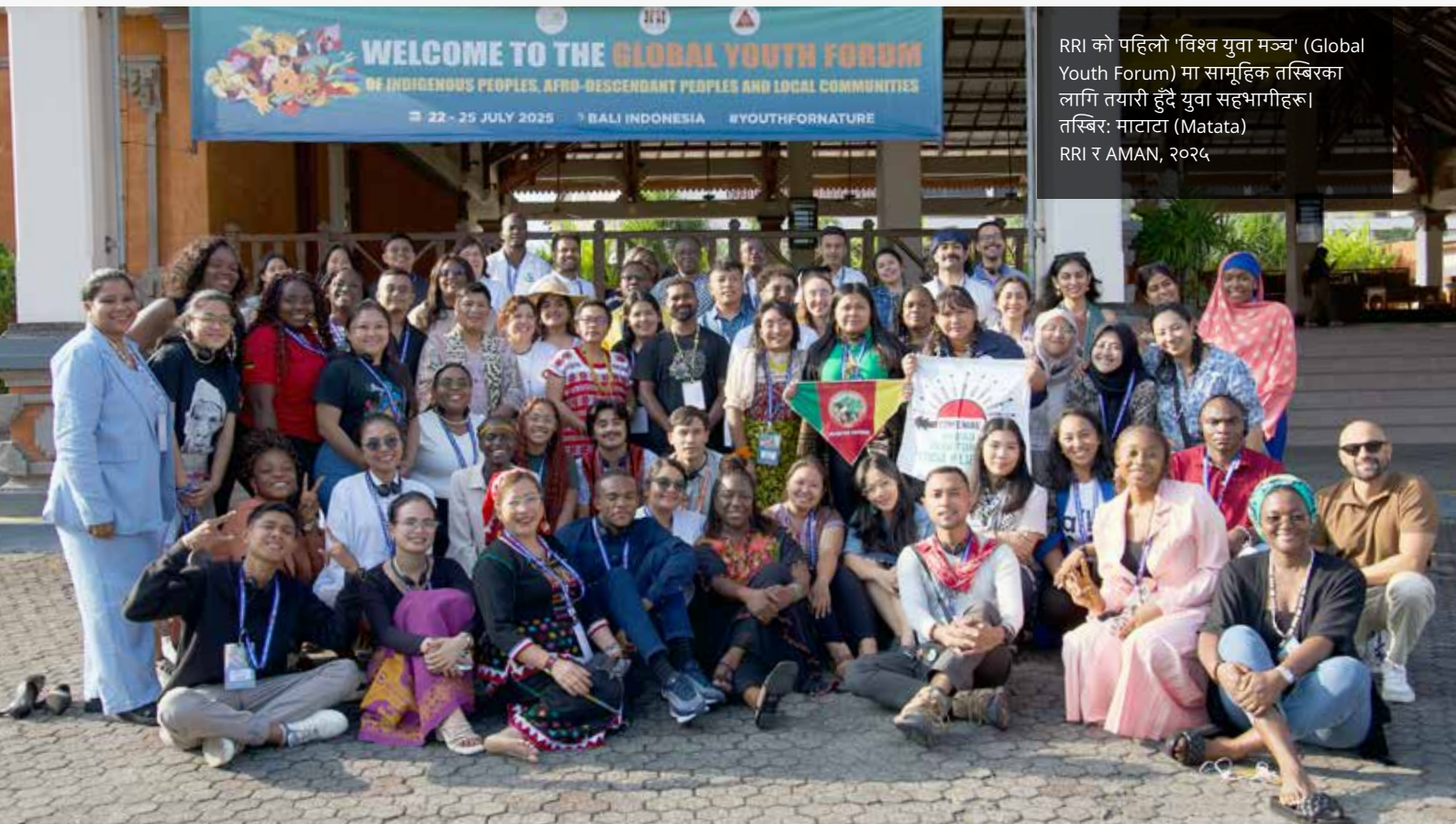
RRI को पहिलो 'विश्व युवा मञ्च' (Global Youth Forum) मा सामूहिक तस्बिरका लागि तयारी हुँदै युवा सहभागीहरू।

यी पहलहरूले संयुक्त रूपमा सन् २०२६ र त्यसपछिका वर्षहरूमा विश्व वातावरणीय शासनमा दिगो युवा नेतृत्व र सहभागिताका लागि आधार तयार गर्छन्।