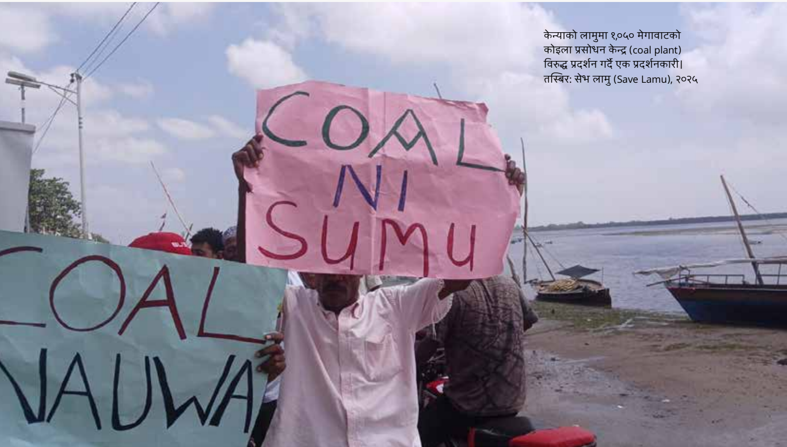
केन्याको लामुमा १,०५० मेगावाटको कोइला प्रसोधन केन्द्र (coal plant) विरुद्ध प्रदर्शन गर्दै एक प्रदर्शनकारी। तस्बिर: सेभ लामु (Save Lamu), २०२५

केन्यामा, RRI ले लामु (Lamu) मा प्रस्तावित कोइला प्लान्ट र किटुई (Kitui) मा भइरहेको नयाँ कोइला उत्खननको खोजी कार्यलाई रोक्न 'deCOALonize' अभियानमार्फत समुदायको नेतृत्वमा सञ्चालित सफल अभियानलाई सहयोग पुऱ्यायो। RRI ले महिला र युवाहरू सहित २२५ भन्दा बढी समुदायका सदस्यहरूलाई हानिकारक कोइला प्रशोधन विरुद्ध आवाज उठाउन आवश्यक सहयोग र उपकरणहरू उपलब्ध गराएको थियो। यसले राष्ट्रिय वातावरणीय न्यायाधीकरणको निर्णयलाई समर्थन गर्दै कोइला प्लान्ट रोक्ने ऐतिहासिक अदालतको आदेशबाट जित हासिल गर्न योगदान पुऱ्यायो। RRI ले वातावरण मञ्चहरू, चलचित्र प्रदर्शन, सञ्चारमाध्यममा पहुँच र लोकप्रिय #NowOrNever सामाजिक सञ्जाल अभियानमार्फत यो अभियानलाई अगाडि बढाउन सेन्टर फर ह्युमन राइट्स एण्ड सिभिक एजुकेसन (CHRCE) र सेभ लामु (Save Lamu) जस्ता पहलसँग सहकार्य गरेको थियो।