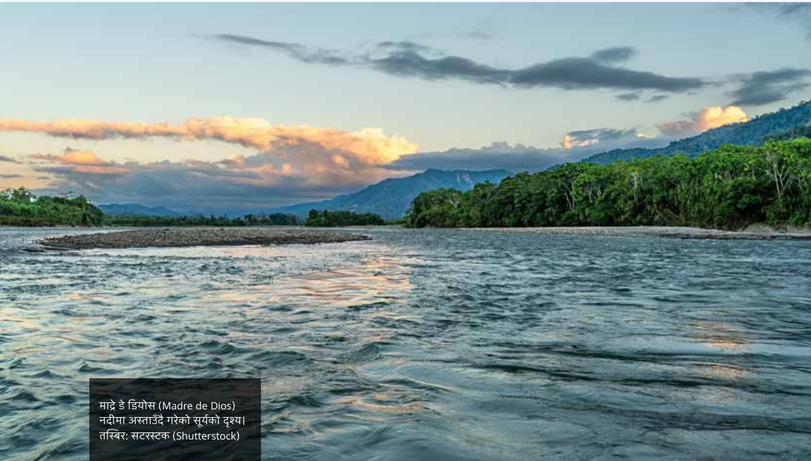
माद्रे डे डियोस (Madre de Dios) नदीमा अस्ताउँदै गरेको सूर्यको दृश्य।

यस कानुनी कारबाहीले अवैध खानी गतिविधिहरूको निलम्बन, नयाँ खानी इजाजतपत्र वितरणमा रोक, र माद्रे दे दिओस (Madre de Dios) नदीलाई अधिकारको सामूहिक विषयको रूपमा मान्यता दिन माग गरेको थियो। यी अन्तरिम आदेशले बोलीभिया र सम्पूर्ण ल्याटिन अमेरिकामा एउटा महत्वपूर्ण नजिर स्थापित गरि, TIM II मा बसोबास गर्ने आदिवासी जनजातिहरूको अधिकार मात्र नभई प्रकृतिका अधिकारहरूलाई लाई पनि मान्यता दिएको छ।