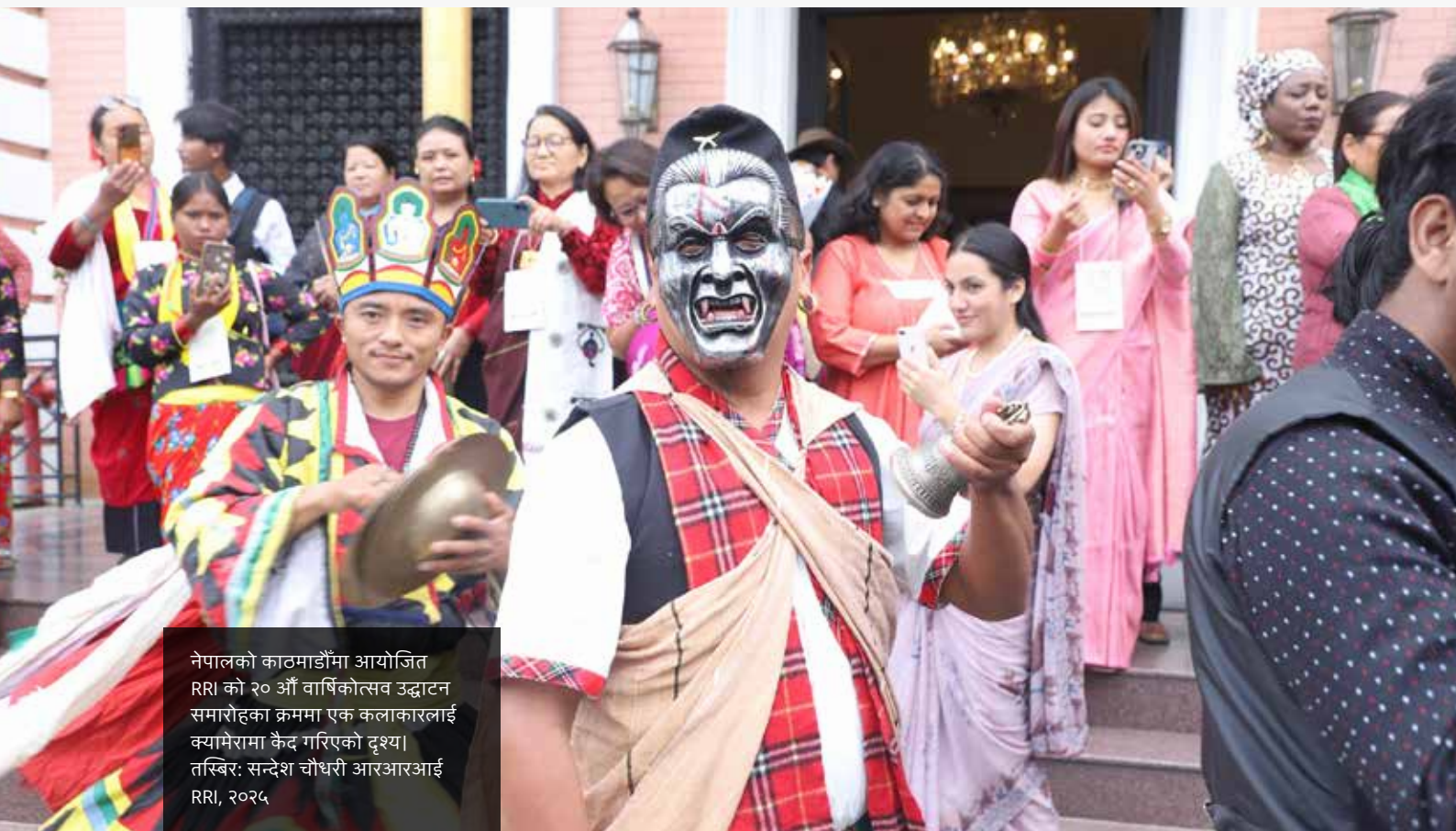
नेपालको काठमाडौंमा आयोजित RRI को २० औं वार्षिकोत्सव उद्घाटन समारोहका क्रममा एक कलाकारलाई क्यामेरामा कैद गरिएको दृश्य।

नेपालको काठमाडौंमा आयोजित RRI को २० औं वार्षिकोत्सव भेलाले ४० भन्दा बढी देशका २४० भन्दा बढी अधिकारकर्मीहरू, सहकार्यकर्ताहरू, संस्थापकहरू र निर्णयकर्ताहरूलाई एकै ठाउँमा ल्यायो। सातवटा स्थानीय साझेदार संस्थाहरू (सामुदायिक वन उपभोक्ता महासंघ नेपाल; नेपाल आदिवासी जनजाति महासंघ; ग्रीन फाउन्डेसन नेपाल; आदिवासी जनजाति अनुसन्धान तथा विकास केन्द्र; नेपाल आदिवासी जनजाति महिला महासंघ; आदिवासी महिला कानुनी सचेतना समूह; र महिला अधिकार तथा स्रोत सञ्जाल) सँगको साझेदारीमा आयोजित यस चार दिने कार्यक्रमले उच्चस्तरीय प्यानलहरू, विषयगत छलफलहरू र गठबन्धनको रणनीति निर्माणका सत्रहरूलाई समेटेको थियो।