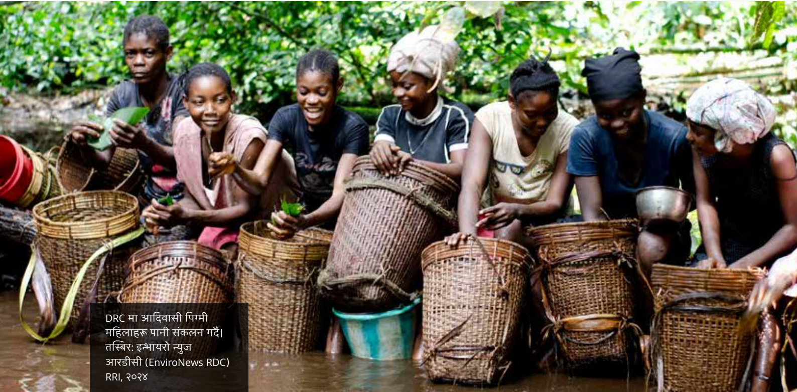
DRC मा आदिवासी पिग्मी महिलाहरू पानी संकलन गर्दै। तस्बिर: इन्भायरो न्युज आरडीसी (EnviroNews RDC) RRI, २०२४

विश्वकै सबैभन्दा ठूलो कार्बन अवशोषण क्षेत्र (Carbon sink) का रूपमा रहेको कङ्गो बेसिनको ६० प्रतिशत हिस्सा ओगटेको DRC ले स्पष्ट 'भूमि-उपयोग ढाँचा' (Land-use framework) को अभावमा लामो समयदेखि द्वन्द्व र वन विनाशको सामना गर्दै आएको थियो। सन् २०२५ जुलाईमा, DRC का राष्ट्रपतिले देशको इतिहासमै पहिलो 'भूमि-उपयोग योजना कानून' (Land Use Planning Law) लाई हस्ताक्षर गर्दै यसलाई कानुनी रूप दिएका थिए। समावेशी र अधिकारमा आधारित भूमि सुशासनका लागि यसले एउटा ऐतिहासिक कदम अगाडि बढाएको छ।