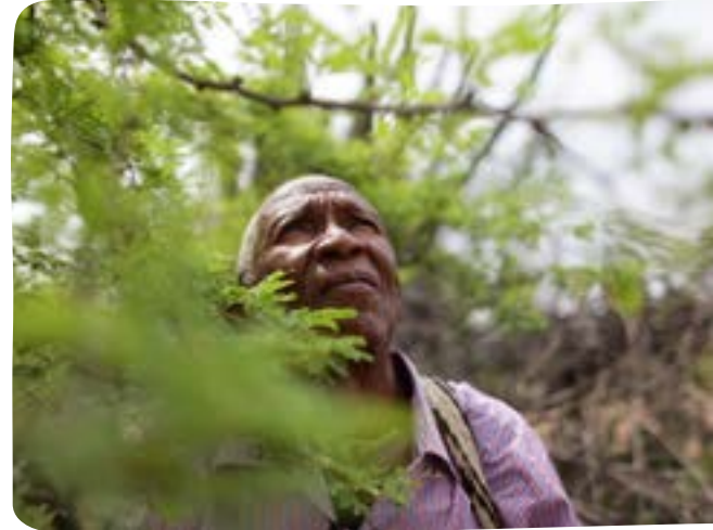
Paisaje de Valledupar, municipio del noreste de Colombia.

También informa sobre los avances en los primeros cinco años (2015–2020) de la adopción de los Objetivos de Desarrollo Sostenible (ODS) y el Acuerdo de París.