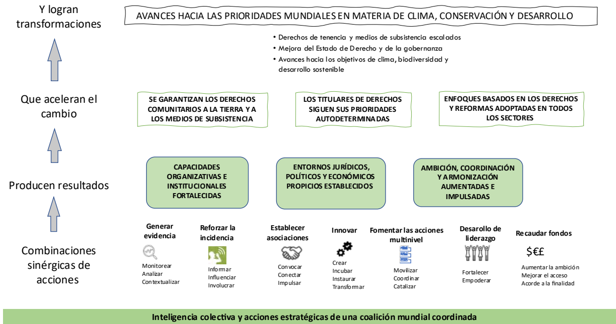
Figura 1: Teoría del Cambio de la RRI