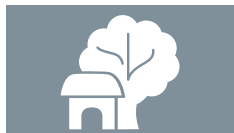
DERECHOS DE PROPIEDAD

*Ningún país estudiado en África o Asia proporciona esta salvaguardia para las mujeres en uniones consensuales.