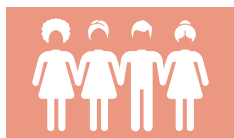
PERTENENCIA A LA COMUNIDAD

América Latina ofrece la mayor protección de los derechos de pertenencia a nivel comunitario de las mujeres, que son los derechos comunitarios más importantes examinados.