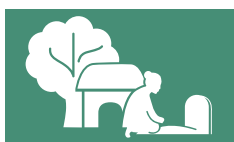
LOS DERECHOS DE HERENCIA AL NIVEL NACIONAL

Los países latinoamericanos son los que brindan las protecciones más sólidas a todos los derechos de herencia para mujeres al nivel nacional.