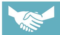
RESOLUCIÓN DE DISPUTAS

América Latina ofrece la mayor protección de los derechos de pertenencia a nivel comunitario de las mujeres, que son los derechos comunitarios más importantes examinados.